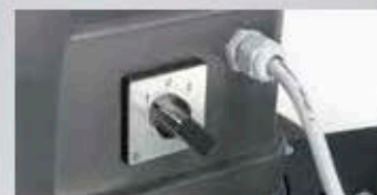
ES 420 DUO mit zwei Geschwindigkeiten