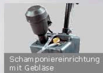
Schamponiereinrichtung mit Gebläse